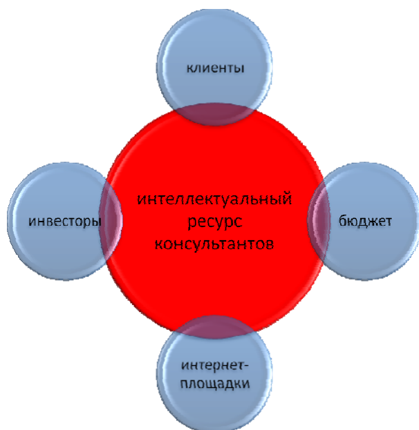
Рисунок 1. Архитектура интернет-сообщества консультантов

номика наоборот, диктует образ мыслей, основанный на кодификации и социализации всех сторон жизни, превращая в центральную инстанцию режимную замкнутость. Между экономикой и интернет возможно сотрудничество, но не компромисс, так как интернет не стремится завоевать и уничтожить экономику. Между экономикой и интернет возможна совместная деятельность, подтверждающая приоритеты нуждающейся стороны. Данное обстоятельство делает возможным организацию интернет-консультирование и обучения на новой концептуальной основе, вне связи с аппаратным мышлением, которое любой бизнес-процесс сводит к распределению прав и обязанностей внутри контролируемого замкнутого пространства. Интернет создает конкурентную среду на уровне консультанта, который «обрастает» вокруг себя инфраструктурой, максимально лояльной к интеллекту и инновациям.